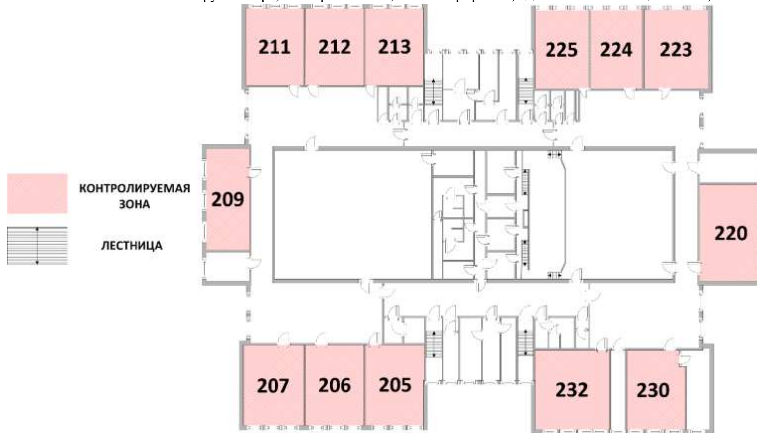
Рисунок 1. Схема границ контролируемой зоны информационной системы «Пункт проведения экзаменов»: 628310, Ханты-Мансийский автономный округ - Югра, г. Нефтеюганск, 16А микрорайон, здание №84 помещение №1, 2 этаж.